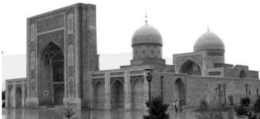
Xasti Imom masjidi. Toshkent.

Turpaket narxi to‘g‘risida fikir yuritilganda, quyidagilarni qayd qilish juda muhim, jumladan: