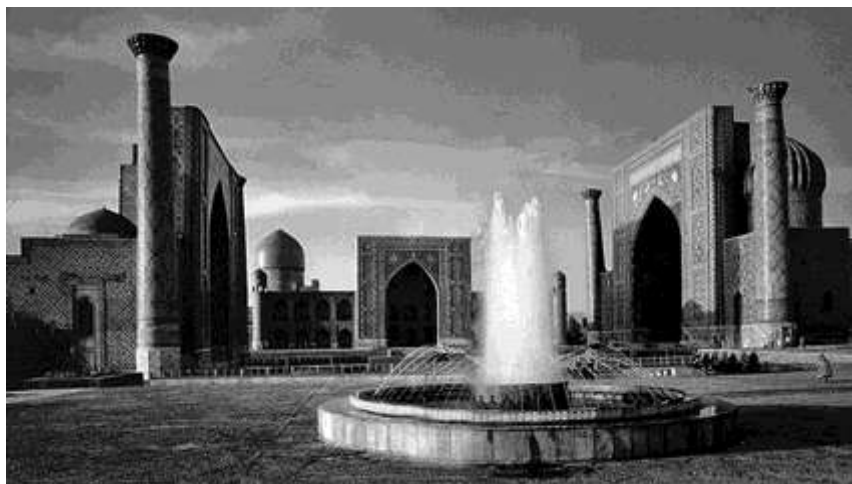
Registon maydoni. Samarqand.

Butunjahon Turistik Tashkiloti qo‘shimcha turistik xizmatlarning 400 xil turini keltirib o‘tgan. Qo‘shimcha turistik xizmatlarning ahamiyati shundaki, unda turist yuzaga kelgan ehtiyojlarini tulaqonli qondiradi, ma’lum bir vazifalarni bajarishda o‘zini urintirmaydi (masalan, mehmonxonada yashayotganida kiyimini tozalash yoki dazmollash uchun mehmonxona xodimlariga murojaat qiladi). Qo‘shimcha turistik xizmatlardan turist 2 xil vaziyatda foydalanadi: turpaketning tanaffus qismida yoki turist bo‘sh qolgan vaqtda foydalanadigan xizmatlar (masalan, Registon maydonida namoyish etiladigan ovozli va nurli panorama tomoshasi).