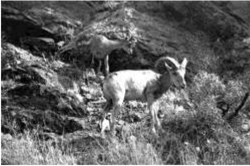
Safari Safary tour –

qo‘riqxonaga hayvonlarni tomosha qilish uchun sayr, ovchilik, baliq ovi maqsadidagi sayohat, fotoovchilik, Keniya yoki JAR qo‘riqxonalariga sayr, tabiatda ajoyib hayvonlarni erkin holda ko‘rish maqsadidagi sayrlar.