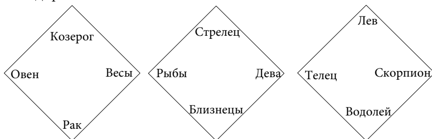
Рис. 2. Отношения оппозиции (180°) и тетрагональные (90°)

✓ В-третьих, все виды пар иерархичны. Пары оказываются устойчивее, когда в роли подчиненного — «ученика», «слуги», «сына», «младшего брата», «подмастерья» — оказывается женский знак или женщина с мужским знаком. Наоборот, мало надежды на сохранение союза, если подчиненным является мужчина с мужским знаком, который обычно не выдерживает давления со стороны жены—«командира».