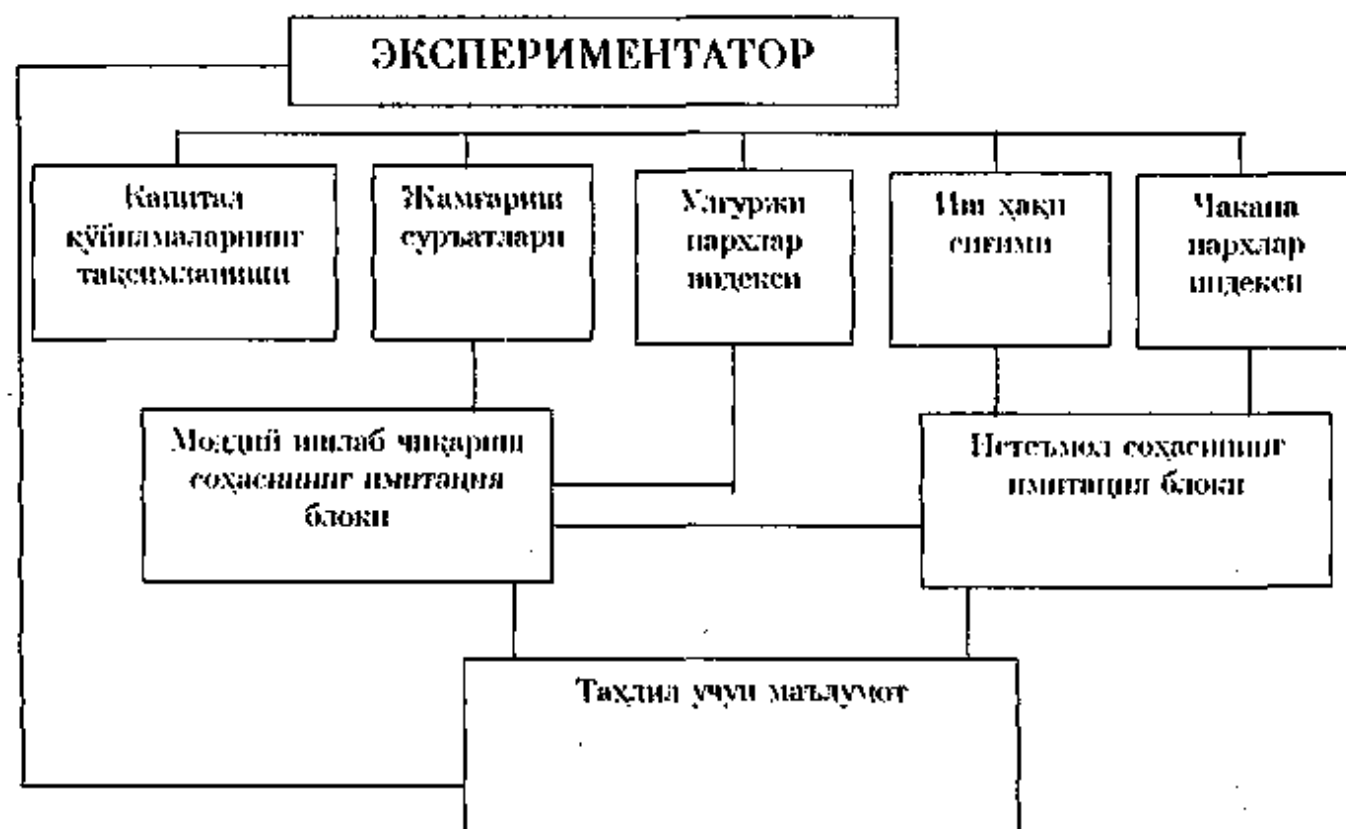
2-раем. Имитацион моделнинг структуравий схемаси

Шундай қилиб, инсон-машина имитацион системаси аҳоли пул даромадлари ва таклиф қилинаётган товар ва хизматлар орасидаги энг яхши нисбатни таъминловчи прогноз вариантларини топишга имкон беради. Бошқарув параметрларини ажратиш, оралиқ қарорларни баҳолаш ва якуний қарорларни танлаш экспериментаторга юкланади, мумкин бўлган кўпчилик ечим вариантлари ЭХМда ечилади.